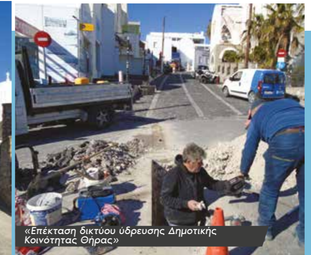
«Επέκταση δικτύου ύδρευσης Δημοτικής Κοινότητας Θήρας»