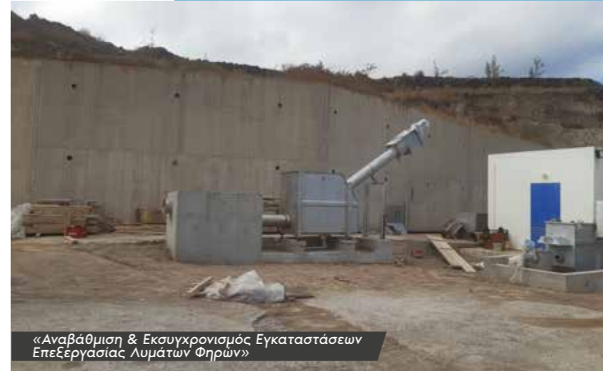
«Αναβάθμιση & Εκσυγχρονισμός Εγκαταστάσεων Επεξεργασίας Λυμάτων Φηρών»