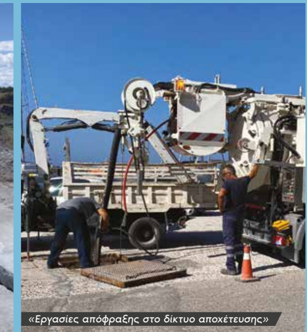
«Εργασίες απόφραξης στο δίκτυο αποχέτευσης»