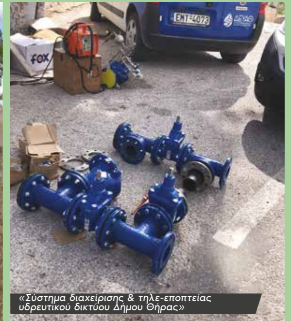
«Σύστημα διαχείρισης & τηλε-εποπτείας υδρευτικού δικτύου Δήμου Θήρας»