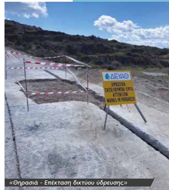
«Θηρασιά - Επέκταση δικτύου ύδρευσης»