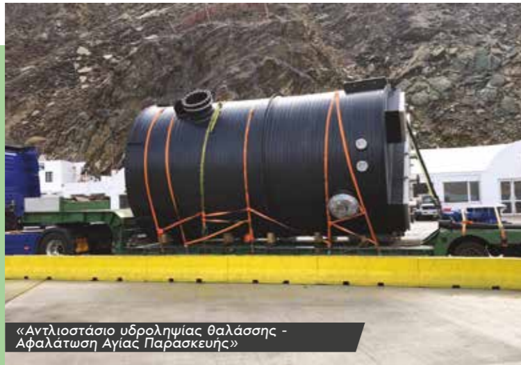
«Αντλιοστάσιο υδροληψίας θαλάσσης - Αφαλάτωση Αγίας Παρασκευής»