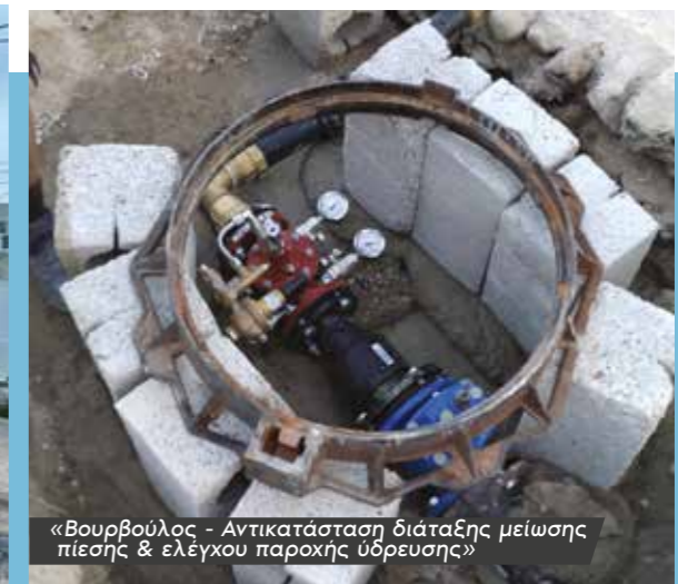
«Βουρβούλος - Αντικατάσταση διάταξης μείωσης πίεσης &amp; ελέγχου παροχής ύδρευσης»