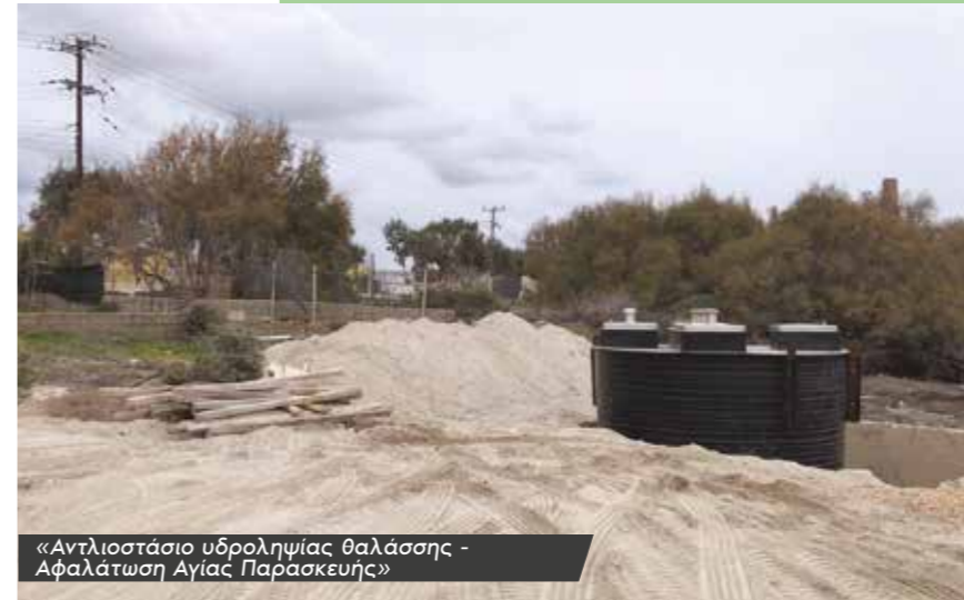
«Αντλιοστάσιο υδροληψίας θαλάσσης - Αφαλάτωση Αγίας Παρασκευής»