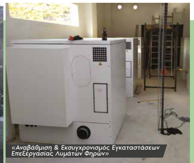
«Αναβάθμιση & Εκσυγχρονισμός Εγκαταστάσεων Επεξεργασίας Λυμάτων Φηρών»