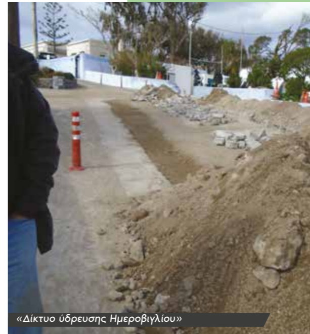
«Δίκτυο ύδρευσης Ημεροβιγλίου»