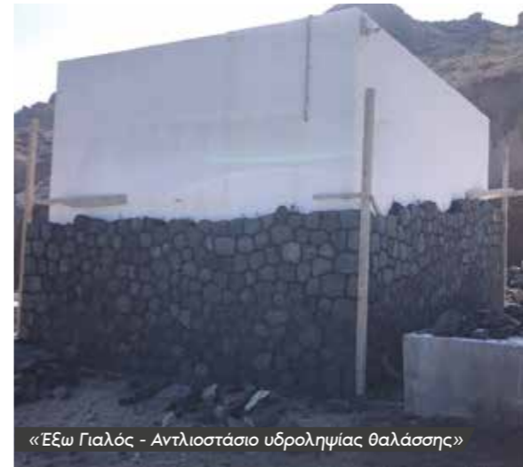
«Έξω Γιαλός - Αντλιοστάσιο υδροληψίας θαλάσσης»