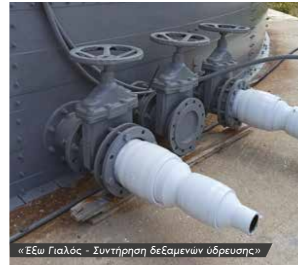
«Έξω Γιαλός - Συντήρηση δεξαμενών ύδρευσης»