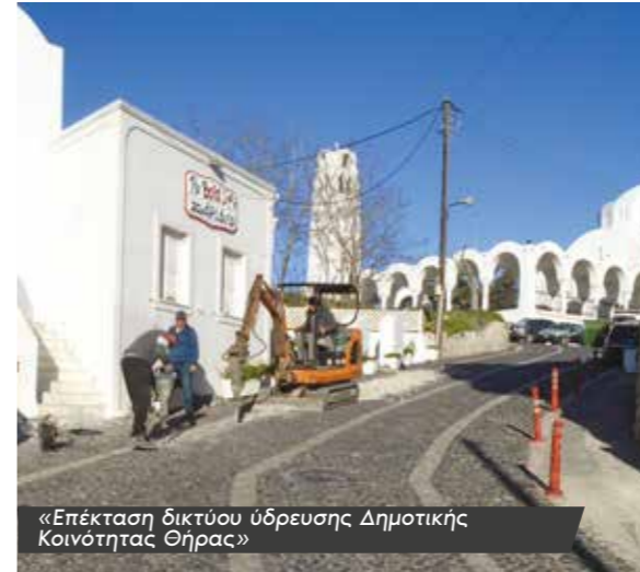
«Επέκταση δικτύου ύδρευσης Δημοτικής Κοινότητας Θήρας»

• Με ομόφωνη απόφαση, το Διοικητικό Συμβούλιο της Δ.Ε.Υ.Α. Θήρας, αναλογιζόμενο τις δυσκολίες που αντιμετώπισαν οι επιχειρήσεις του νησιού, προχώρησε στην έγκριση εκπτώσεων στα τέλη αποχέτευσης για τις επιχειρήσεις του νησιού, που επλήγησαν εξαιτίας της πανδημίας COVID-19 και ανέστειλαν εντελώς την λειτουργία τους για το έτος 2020. Δικαιούχοι της έκπτωσης ήταν οι επιχειρήσεις, που είναι συνδεδεμένες μόνο στο δίκτυο αποχέτευσης της Δ.Ε.Υ.Α.Θ. και χρεώνονται μόνο με πάγια και τέλη αποχέτευσης.