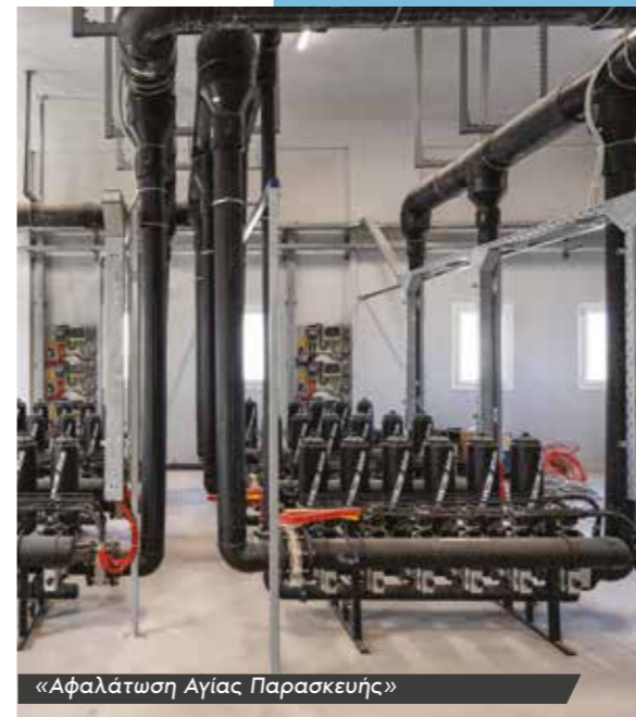
«Αφαλάτωση Αγίας Παρασκευής»