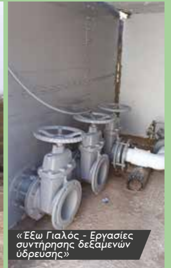
«Έξω Γιαλός - Εργασίες συντήρησης δεξαμενών ύδρευσης»