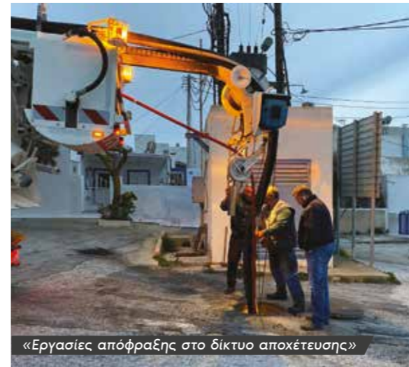
«Εργασίες απόφραξης στο δίκτυο αποχέτευσης»