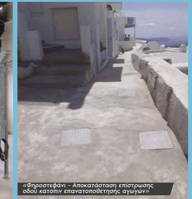
«Φηροστεφάνι - Αποκατάσταση επίστρωσης οδού κατόπιν επανατοποθέτησης αγωγών»