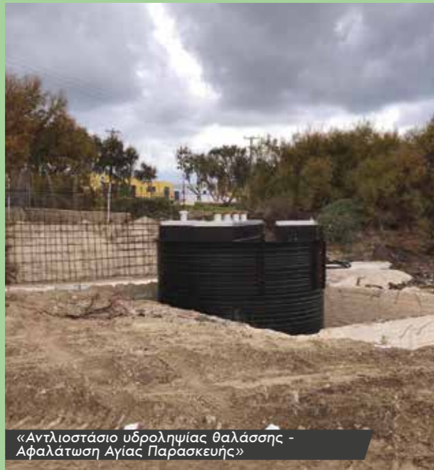
«Αντλιοστάσιο υδροληψίας θαλάσσης - Αφαλάτωση Αγίας Παρασκευής»