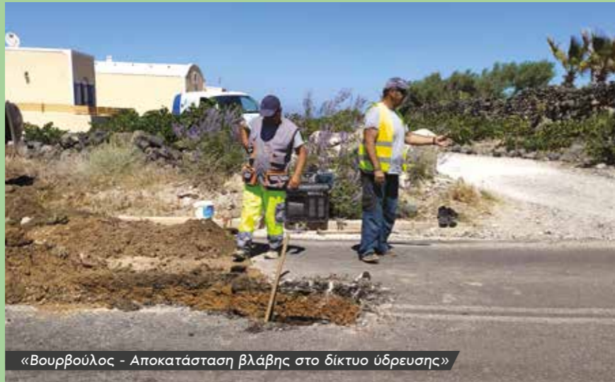
«Βουρβούλος - Αποκατάσταση βλάβης στο δίκτυο ύδρευσης»