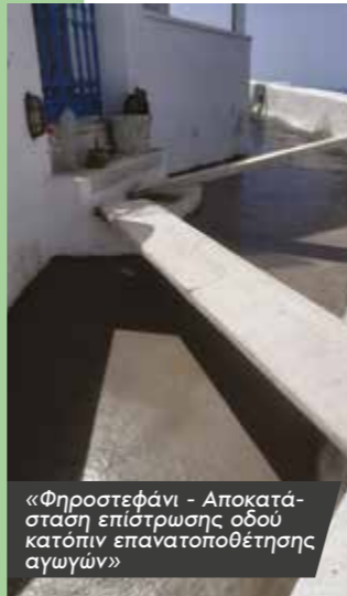
«Φηροστεφάνι - Αποκατάσταση επίστρωσης οδού κατόπιν επανατοποθέτησης αγωγών»