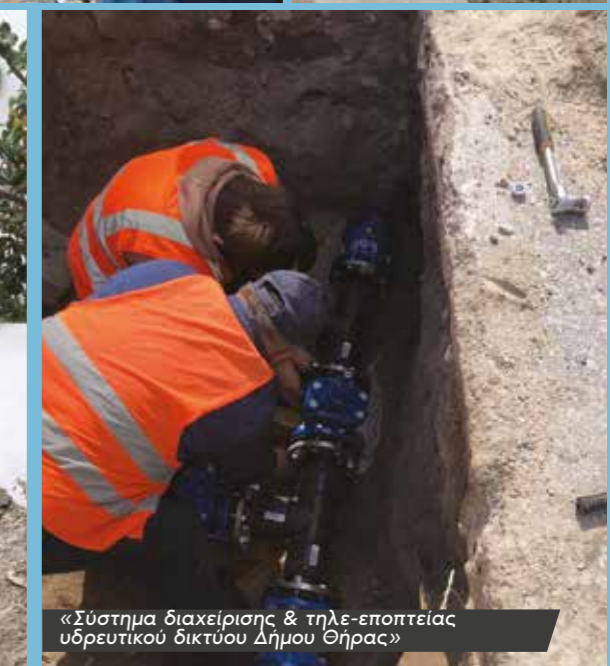
«Σύστημα διαχείρισης &amp; τηλε-εποπτείας υδρευτικού δικτύου Δήμου Θήρας»