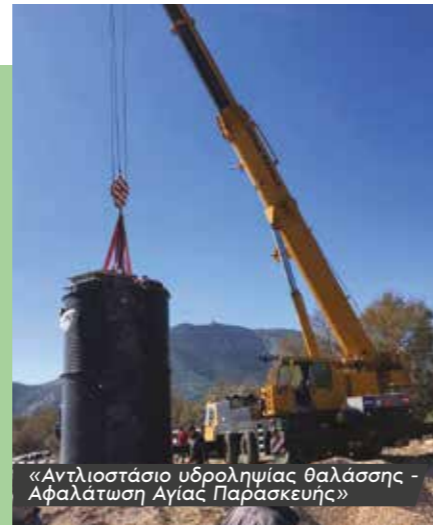
«Αντλιοστάσιο υδροληψίας θαλάσσης - Αφαλάτωση Αγίας Παρασκευής»