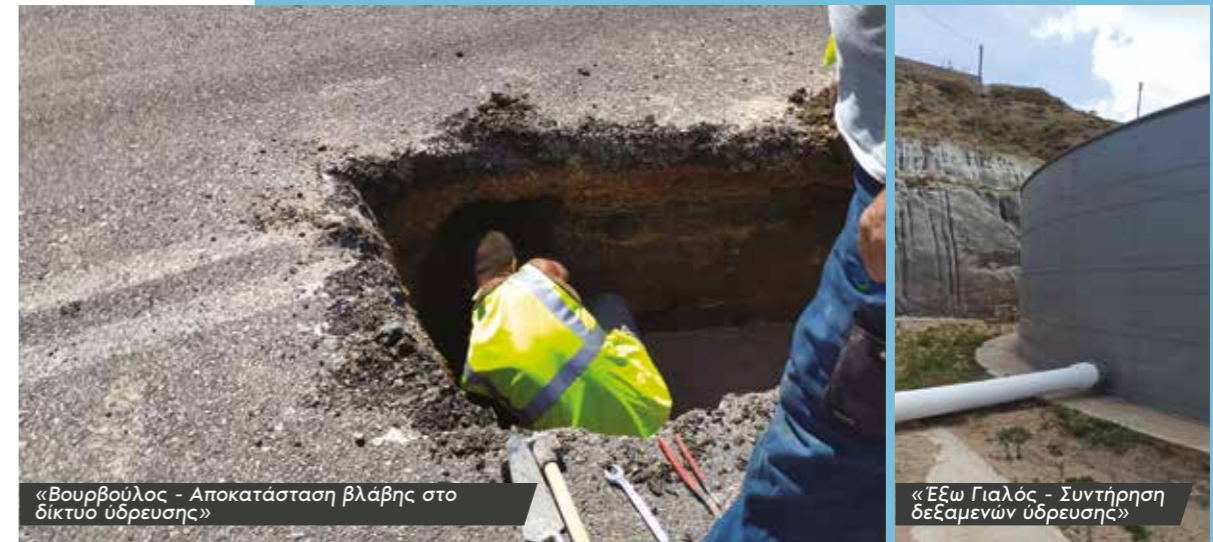
«Βουρβούλος - Αποκατάσταση βλάβης στο δίκτυο ύδρευσης»