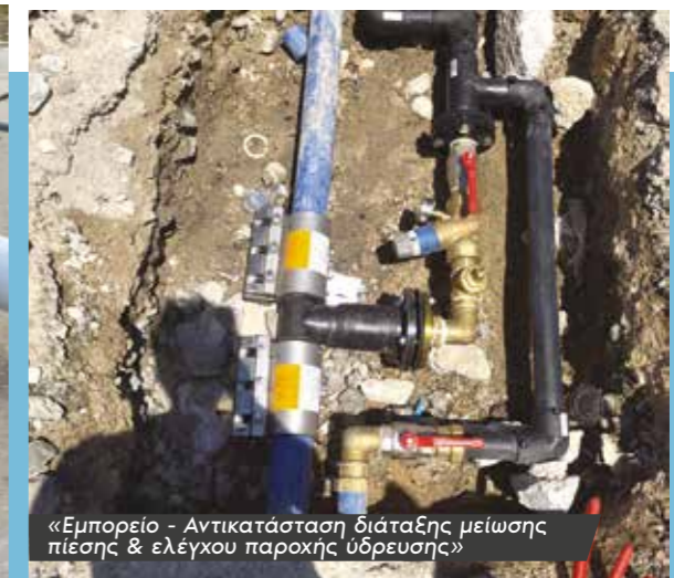
«Εμπορείο - Αντικατάσταση διάταξης μείωσης πίεσης &amp; ελέγχου παροχής ύδρευσης»