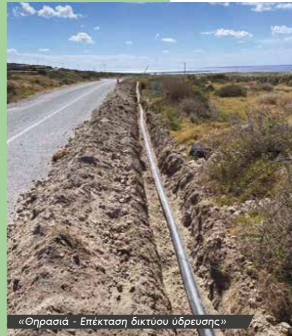
«Θηρασιά - Επέκταση δικτύου ύδρευσης»