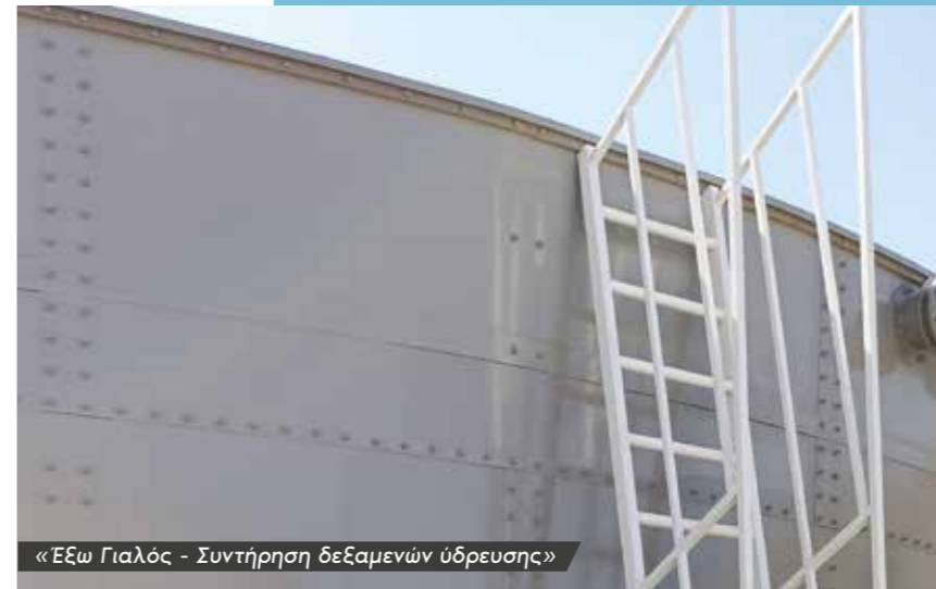
«Εξω Γιαλός - Συντήρηση δεξαμενών ύδρευσης»