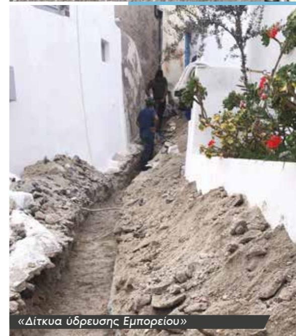
«Δίκτυα ύδρευσης Εμπορείου»