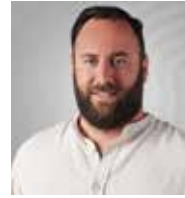
ΓΑΔ ΥΑΚΙΝΘΟΣ (ΑΚΗΣ)