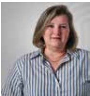
ΠΡΙΝΤΖΗ ΘΗΡΕΣΙΑ (ΑΝΑΠΟΔΟΣ)